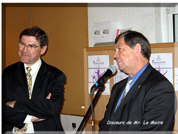
Discours de Mr. Le Maire

Du 4 au 7 avril, les membres de CLIC Triel ont exposé plus d'une centaine d'images de qualité. Le concept "un Auteur un Thème" donne beaucoup de liberté pour le club lui-même ainsi qu'aux membres. Prochainement nous vous proposerons une visite virtuelle, pour voir ou revoir les images de chacun.