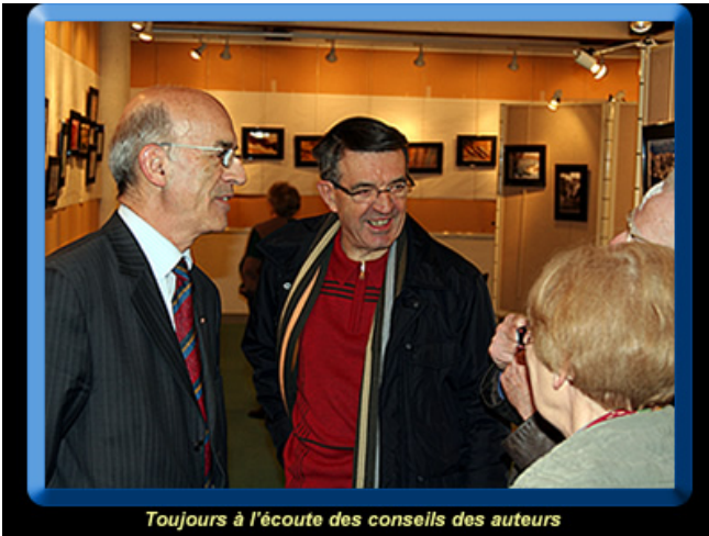
Toujours à l'écoute des conseils des auteurs

Ce fut l'occasion aussi de rencontres fructueuses entre auteurs et passionnés d'images