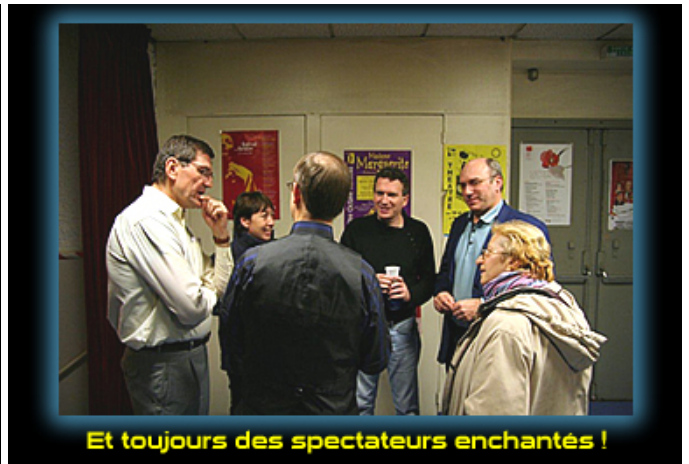
Et toujours des spectateurs enchantés !