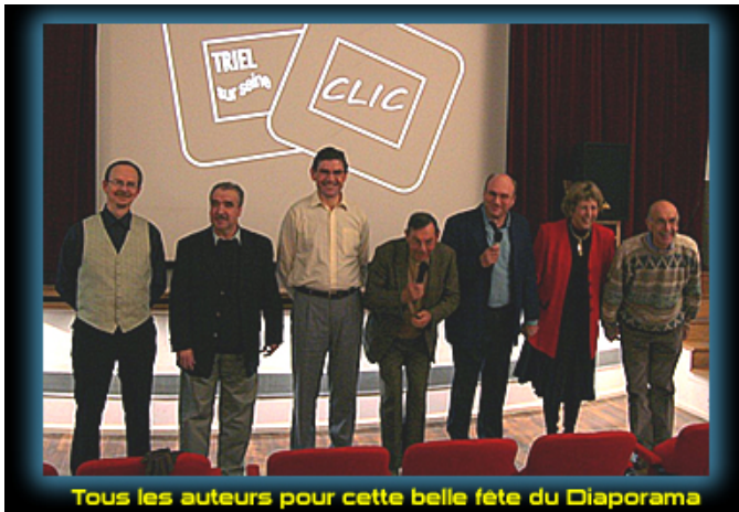
Tous les auteurs pour cette belle fête du Diaporama