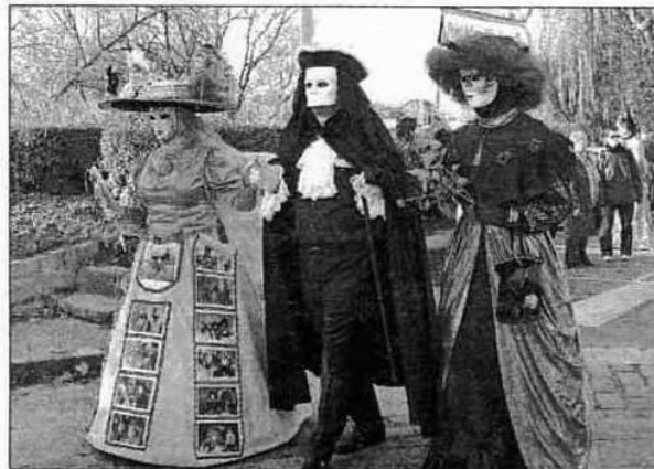
Onze personnages venus des quatre coins de France ont défilé.